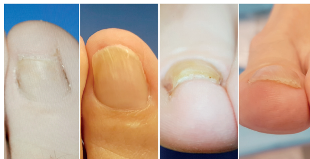
Figura 9. Imágenes clínicas de un caso, preoperatoria y 1 año posoperatoria, visión dorso-plantar.

falange o un nuevo componente con un proceso de degradación o absorción que comprometa la estabilidad, confiamos en los frutos de I+D de los laboratorios.