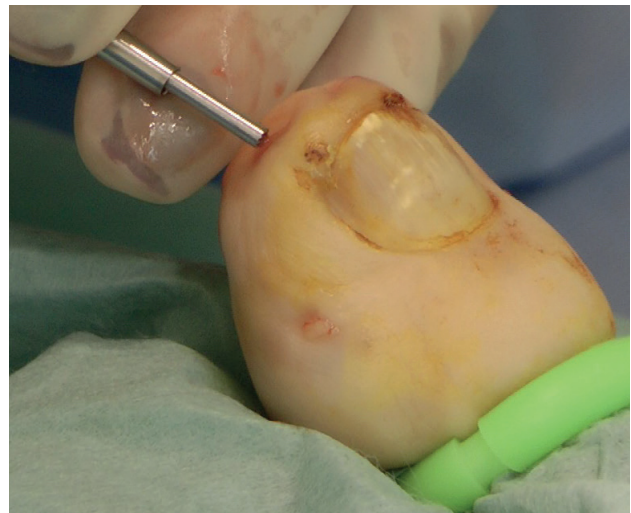
Figura 7. Impactando el extremo distal de la aguja absorbible después de ser cortada.

que introducir un elevador tipo Freer u osteotomo de 2 mm (Figura 5) para elevar y preservar la matriz ungueal.