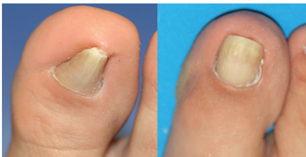
Figura 8. Imágenes clínicas de un caso, preoperatorias y 1 año postoperatoria, visión dorso-plantar y antero-posterior.