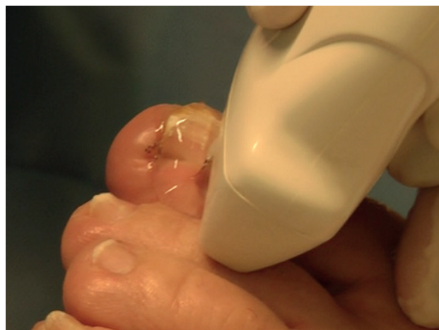
Figura 3. Localización de los extremos de la matriz ungueal con el ecógrafo.