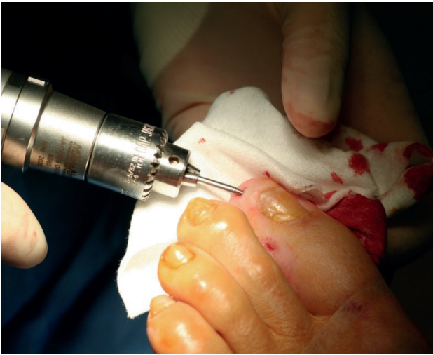
Figura 4. Aplanamiento de la cara dorsal de la falange distal por mínimas incisiones distales.