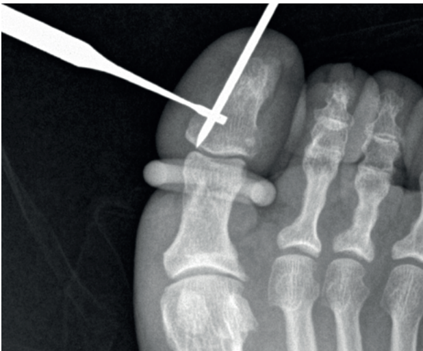
Figura 6. Rx dorso-plantar que confirma que la aguja-guía llega a la cortical de la base de la falange distal.