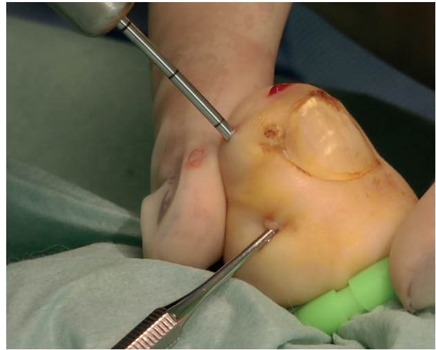
Figura 5. En proximal elevador tipo Freer preservando la matriz. En distal se introduce la aguja-guía de 100 mm con marcas cada 10 mm.