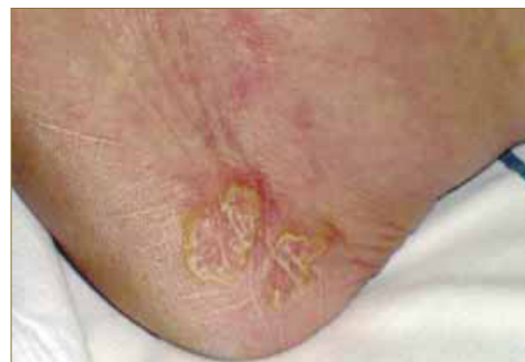
Figura 1. Aspecto de las lesiones en el lateral del tobillo.

Una vez en consulta, se procede a la exploración clínica, observándose varias lesiones cutáneas en la cara lateral del talón del pie derecho, con un crecimiento progresivo de las mismas a lo largo de los 5 últimos años. Se trataba de 2 placas redondeadas, de bordes bien definidos, de 5x4 cm de tamaño, de fondo ligeramente eritematoso a la luz, cuyo centro es ligeramente atrófico, alopecíco, con escamas, y un borde circinado, bien definido, elevado e hiperqueratósico. El resto de piel y anexos no presentaban alteraciones.