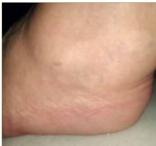
Figura 3. Aspecto de la zona afectada tras el tratamiento.