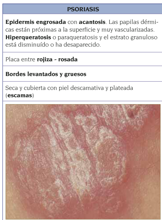
Tabla 1. Diagnóstico diferencial entre poroqueratosis, hiperqueratosis y psoriasis.