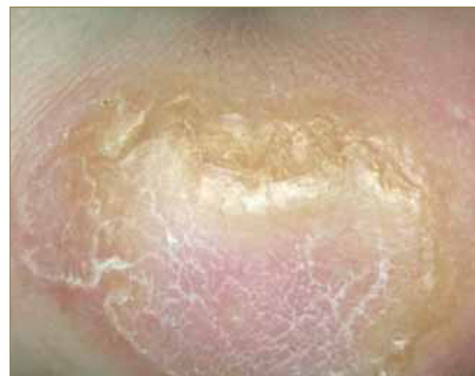
Figura 2. Visión aumentada de las lesiones.