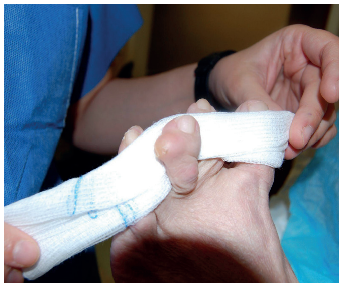
Figura 1. Visión de la lesión nodular en el tercer dedo del pie izquierdo.

Una vez realizada la exploración, y valorando los datos de la paciente (antecedentes de AR y lupus eritematoso), el diagnóstico inicial fue de nódulo reumatoide.