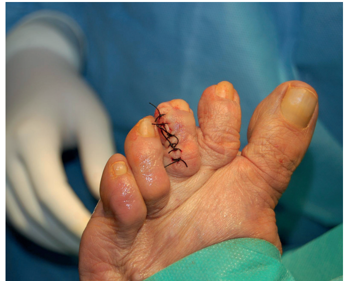
Figura 5. Sutura de la incisión con seda trenzada no absorbible.

área central de aspecto quístico con disrupción y presencia de células necróticas epiteliales y sustancia eosinófila compatible con queratina (Figura 6).