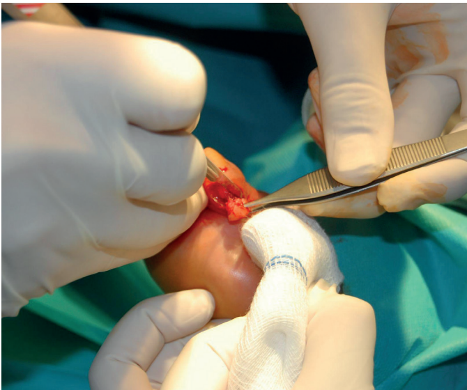
Figura 3. Escisión del nódulo reumatoide.