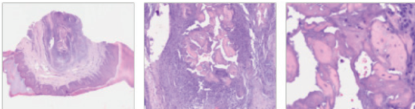
Figura 6. Microfotografía de la preparación histológica de la lesión teñida con hematoxilina-eosina que muestra células epiteliales necróticas y reacción inflamatoria.

fundas como el periostio, la fascia o los tendones, y suelen presentarse en articulaciones metacarpofalángicas, metatarsofalángicas e interfalángicas 2 . Estos nódulos también pueden manifestarse entre el 5-7 % de los pacientes afectados de lupus eritematoso sistémico 11 . Las complicaciones posibles de este tipo de lesiones son dolor, limitación de la movilidad de la articulación, ulceración, fístulas e infección 12 .