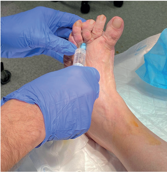
Figura 2. Bloqueo anestésico en la base del tercer dedo del pie izquierdo.