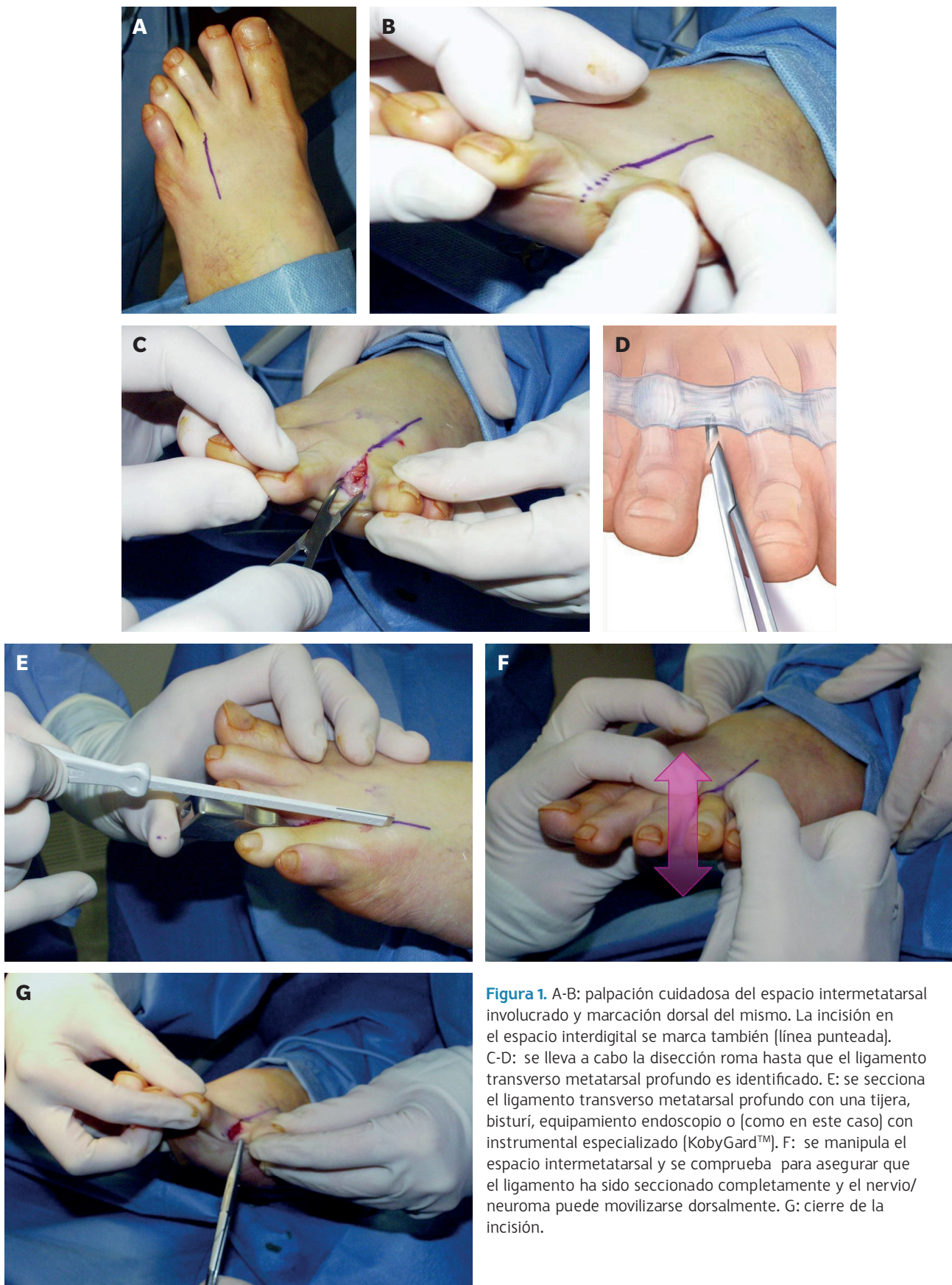
Figura 1. A-B: palpación cuidadosa del espacio intermetatarsal involucrado y marcación dorsal del mismo. La incisión en el espacio interdigital se marca también (línea punteada). C-D: se lleva a cabo la disección roma hasta que el ligamento transverso metatarsal profundo es identificado. E: se secciona el ligamento transverso metatarsal profundo con una tijera, bisturí, equipamiento endoscópico o [como en este caso] con instrumental especializado [KobyGard™]. F: se manipula el espacio intermetatarsal y se comprueba para asegurar que el ligamento ha sido seccionado completamente y el nervio/neuroma puede movilizarse dorsalmente. G: cierre de la incisión.