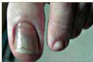
Figura 7: Hematoma ungueal traumático con sobreinfección micótica.

Para realizar un correcto diagnóstico se debe interrogar al paciente sobre su ocupación, antecedentes traumáticos, deportes que practica, antecedentes quirúrgicos, tipo de calzado, etc.