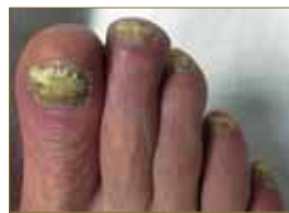
Figura 5: Onicomycosis con paroniquia asociada.