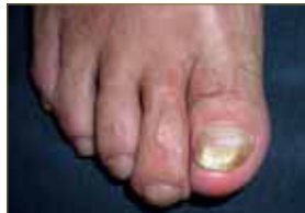
Figura 10: Traumatismo ungueal con onicolisis distal sin hiperqueratosis subungueal, a diferencia de la onicomicosis.