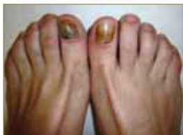
Figura 9: Distrofia ungueal traumática con hemorragias subungueales asociadas y onicomadesis (desprendimiento proximal del plato ungueal).