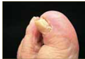
Figura 3: Onicomycosis y onicodistrofia total secundaria.

suele ir asociada a tiña pedis. Como factores predisponentes encontramos la humedad por transpiración excesiva, las alteraciones de la morfología ungueal y los traumatismos que predisponen a la entrada de hongos. También son factores de riesgo la insuficiencia arterial, la inmunosupresión, la Diabetes mellitus, la edad avanzada, el tabaco y el consumo de ciertos fármacos.