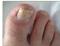
Figura 4: Leuconiquia e hiperqueratosis subungueal por onicomycosis.A