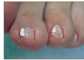
Figura 6: Onicomycosis blanca superficial.

Según la localización de la infección, hay 4 patrones de onicomycosis (Tabla 4).