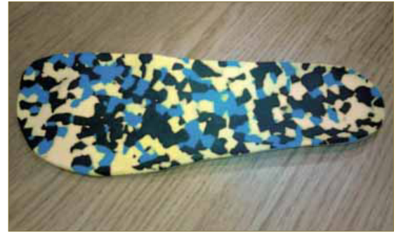
Imagen 10: Plantilla Rígida.