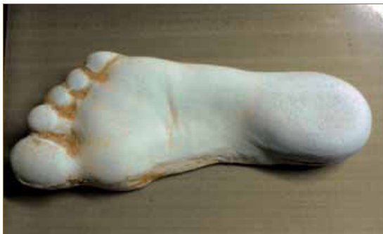
Imagen 7: Molde de escayola.

Toma de molde, en espuma fenólica en carga, molde tomado sin corrección.