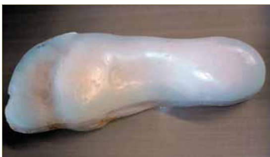
Imagen 8 : Armazón de Polipropileno de 3 mm.

Realizamos una ortesis termoconformada, el armazón realizado en polipropileno de 3mm, el forro superior de EVA de 45 shore A de 3 mm.