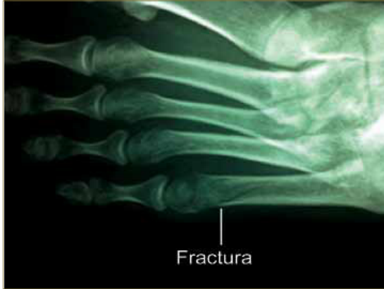
Imagen 6: Radiografía AP de pie izquierdo con fractura del quinto metatarsiano con una semana de evolución.

Le realizamos nuevas radiografías para valorar la evolución de la fractura en la proyección anteroposterior.