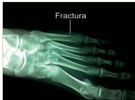
Imagen 5: Radiografía AP de pie izquierdo con fractura.

TRATAMIENTO FUNCIONAL DE FRACTURAS DEL QUINTO METATARSIANO: A PROPÓSITO DE UN CASO