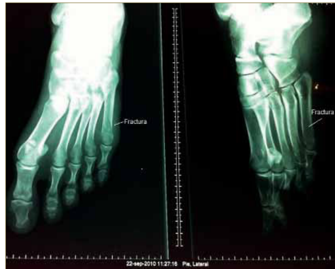
Imagen 3 : Radiografías AP y Lat, pie izquierdo.

Otro aspecto importante desde el punto de vista anatómico es el de la vascularización del 5º metatarsiano, lo que explicaría las distintas evoluciones de estos tipos de fracturas. La tuberosidad presenta una importante vascularización que penetra en la misma a través de las múltiples inserciones tendino ligamentosas 12 . Por el contrario la diáfisis se nutre a través de los vasos periósticos y de la arteria nutricia que se transforma en una arteria centromedular que irriga hasta la zona metafisiaria proximal. La irrigación de la base y de la diáfisis no establece anastomosis entre si, por lo que si se desencadena una fractura en la zona dependiente de la arteria centromedular, que afecte dicha arteria y la vascularización perióstica, provocará una ausencia de vascularización del fragmento proximal, lo que favorecerá un aparición en el retraso de consolidación o una no unión. Esto no suele ocurrir a nivel de la tuberosidad por la presencia de múltiples puntos de entrada de la vascularización 1, 2, 13 .