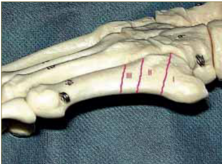
Imagen 1. Fotografía donde se representan las diferentes zonas de la clasificación de las fracturas del 5º metatarsiano proximal 9 .

Otro aspecto importante a tener en cuenta para el tratamiento son los aspectos anatómicos de la porción proximal del 5º Metatarsiano. Desde el punto de vista anatómico podemos diferenciar cinco áreas en el 5º metatarsiano: cabeza, cuello, diáfisis, base y tuberosidad 5, 11 .