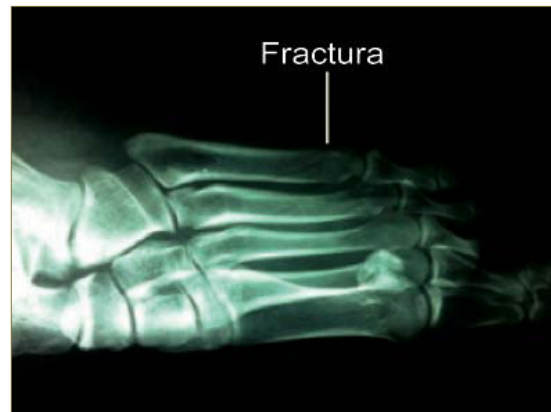
Imagen 4 : Radiografía Lateral de pie izquierdo con fractura.