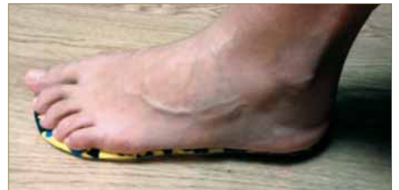
Imagen 11: Tratamiento funcional.

A la semana vuelve de nuevo a la consulta la paciente, para un seguimiento clínico y así se sigue realizando un seguimiento semanal durante tres semanas más y posteriormente bisemanal hasta el alta a las 6 semanas.