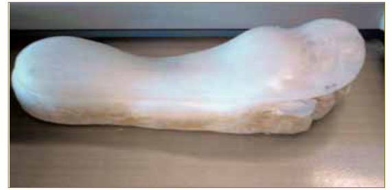
Imagen 9: Armazón de Polipropileno de 3 mm.