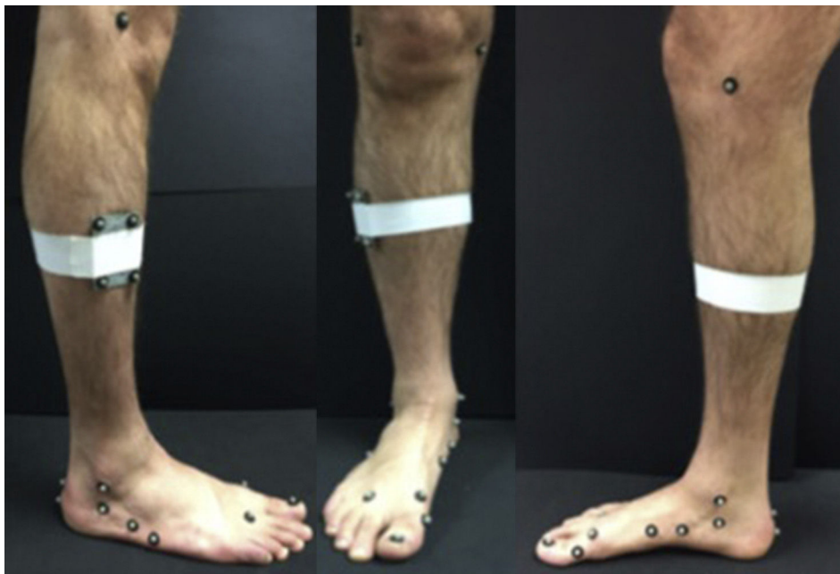
Figura 1 Sistema de marcadores utilizado para el análisis cinemático y cinético de los individuos.

Para obtener los momentos articulares del tobillo, articulación del mediopié y MTF se utilizaron los datos registrados mediante una plataforma de presiones junto con la localización tridimensional de los centros articulares obtenidos mediante el modelo de Bruening descrito anteriormente. La plataforma de presiones (0,40 m × 0,40 m, 40 × 40 celdas)