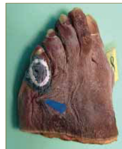
Fig. 5. Marcado externo con bario del contorno de la lesión.

tisulares y sobre todo no infiltraba a la cápsula articular y por tanto no afectaba en absoluto a ninguno de los componente articulares, ni al tejido cartilaginoso, ni al óseo (Fig. 7-8)