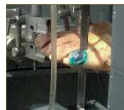
Fig. 9. Sección sagital del dedo.