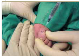
Fig. 4. Lateralización de la aguja para infiltrar en abanico.