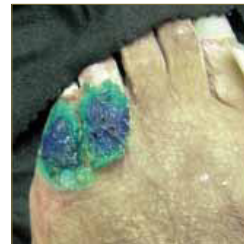
Fig. 7. Disección del dedo y observación de la distribución del producto.