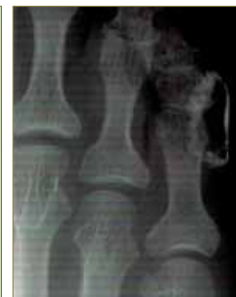
Fig. 6. Radiografía de comprobación del marcaje.