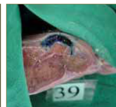
Fig. 10. Observación de la distribución del producto en el dedo seccionado.

Todos los datos seleccionados en los especímenes y observados en ellos fueron trasladados a la hoja de control de los especímenes, (Anexo) donde se registraron para su posterior análisis: