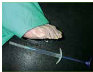
Fig. 2. Preparación del espécimen y tintado del PAAG.

lizarlo (Fig.2). Un punto importante del estudio preliminar consistía en comprobar que en los especímenes no se producía una diseminación y/o infiltración del gel a tejidos adyacentes, con la consiguiente alteración de los mismos.