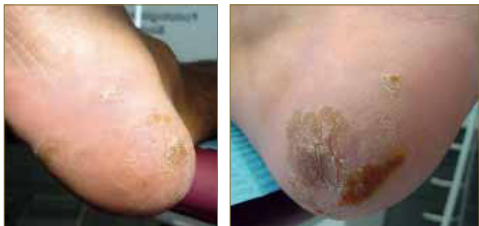
Figuras 9 y 10. Aspecto de las dos lesiones principales al mes de tratamiento. Se aprecia una evolución muy favorable de las mismas con una reducción de tamaño muy significativo. A partir de este momento se establece una cura semanal.

A partir del primer mes, una vez que las lesiones principales presentaban ya un tamaño muy inferior al inicial, se decidió pasar a la modalidad habitual de curas con ácido nítrico, esto es, una cura semanal. Llegados a este punto se decidió aplicar también ácido a las lesiones satélite de mayor tamaño para acelerar su resolución si bien todas ellas presentaban ya un tamaño con una clara tendencia a disminuir progresivamente. Fueron necesarias otras tres curas semanales antes de establecer el alta definitiva.