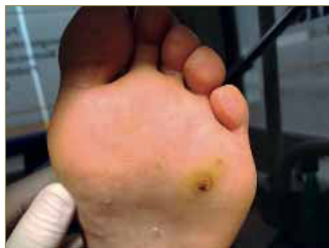
Figura 1. Lesión madre de una verruca plantar en mosaico y múltiples lesiones incipientes diseminadas por toda la zona de antepié.

Este tipo de lesiones son consideradas por la mayoría de los clínicos como las más complicadas de manejar debido a la amplia extensión que ocupan, lo que reduce las posibilidades de uso de diferentes productos habituales en el tratamiento de las verrugas plantares 2 .