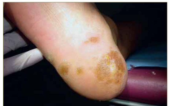
Figura 8. Aspecto de la lesión principal del talón del pie derecho tras cuatro aplicaciones de nítrico (2 semanas de tratamiento). Se aprecia un punteado negro que corresponde a los capilares cauterizados por el ácido.

Es muy importante implicar al paciente en el tratamiento y seguir estrictamente el protocolo de curas propuesto. En este caso durante las 3 primeras semanas se realizaron dos curas semanales única y exclusivamente centradas en las lesiones principales. A las 3 semanas de tratamiento se apreciaba una evolución muy favorable de las lesiones principales así como la remisión de las lesiones satélite de menor tamaño. Además, el paciente refirió que tanto la lesión de la mano como las del muslo desaparecieron espontáneamente sin ningún tratamiento, lo que refuerza la hipótesis del importante papel que juega el sistema inmune en la lucha contra las verrugas víricas.