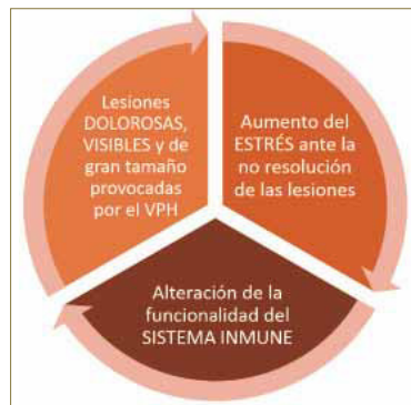
Figura 3. Ciclo vicioso entre lesiones, estrés emocional asociado a las mismas y sistema inmune del paciente.

Para dotar de un rigor científico a esta relación que clínicos de todo el mundo han observado a lo largo de la historia se han desarrollado diferentes escalas validadas para cuantificar el estrés emocional de los sujetos con enfermedades de la piel que pudieran guardar alguna relación con el sistema inmunitario como es el caso de las enfermedades autoinmunes o las infecciones donde probablemente el estrés y la ansiedad provoquen cambios neuroendocrinos y del sistema nervioso autónomo que aún deben ser investigados en profundidad desde un punto de vista fisiopatológico para establecer su papel como modificadores de la respuesta inmune 5, 6, 7, 8 .