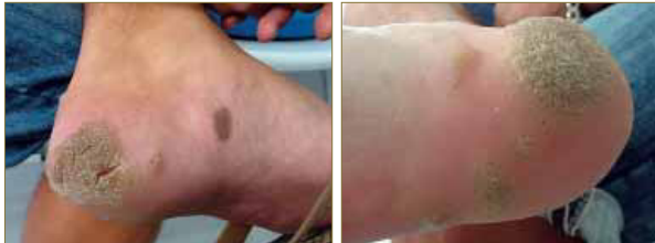
Figuras 4 y 5. Aspecto de las lesiones en el momento de la primera consulta. Se aprecian dos lesiones de gran tamaño con presentación en beso (kissing lesions).

El paciente acude a consulta buscando una solución quirúrgica para su problema ya que, según refiere, ha estado en torno a ocho meses siendo tratado por otro profesional con cristales de ácido monocloracético en ciclos semanales, padeciendo importantes episodios de dolor que le impedían incluso conciliar el sueño con el agravante de que las lesiones en el transcurso del tiempo fueron aumentando en número y tamaño.