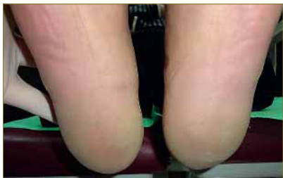
Figura 13. Aspecto definitivo tras el alta. Remisión completa de todas las lesiones.

En total, se realizaron 10 aplicaciones con ácido nítrico repartidas en 7 semanas de tratamiento. Tras el alta clínica se citó al paciente un mes después para constatar la evolución y se pudo evidenciar la resolución definitiva de todas las lesiones.