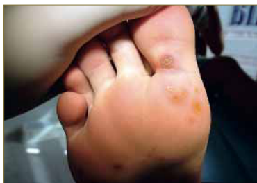
Figura 2. Diseminación de verrugas a partir de una lesión madre en la base del 1º dedo tras varios meses de evolución. Aparición de múltiples lesiones en diferentes localizaciones del antepié.

Es frecuente que este tipo de pacientes se presenten en consulta con cierto grado de desesperación tras haber sido tratados por diferentes terapeutas con resultados insatisfactorios después de meses y meses de tratamiento en los que las lesiones, lejos de desaparecer, han aumentado en número y tamaño. En otras ocasiones, el carácter asintomático que suelen tener las verrugas en mosaico da lugar a despreocupación por parte del paciente que solo busca tratamiento cuando, tras meses de evolución, las lesiones empiezan a ser más numerosas, amplias y sintomáticas.