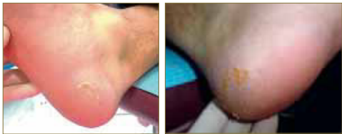
Figuras 11 y 12. Aspecto de las dos lesiones principales a las 6 semanas de tratamiento (9 aplicaciones de ácido nítrico). Todas las lesiones satélites han remitido y únicamente quedan algunos restos de las lesiones principales.

En total, se realizaron 10 aplicaciones con ácido nítrico repartidas en 7 semanas de tratamiento. Tras el alta clínica se citó al paciente un mes después para constatar la evolución y se pudo evidenciar la resolución definitiva de todas las lesiones.