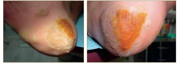
Figuras 6 y 7. Deslaminado de la lesión principal y aplicación de ácido nítrico en un sector de la misma dejando las lesiones secundarias sin tratamiento inicialmente hasta ver evolución de las mismas según evolucionen las lesiones principales.

Para ello, se establece como objetivo la eliminación de las dos lesiones principales ubicadas en el talón de ambos pies, dejando en un segundo plano inicialmente el resto de lesiones. Dada la gran extensión de las dos lesiones principales, se decide dividir cada una de ellas en sectores y se propone al paciente acudir a consulta cada 3 días para ir tratando alternativamente las diferentes zonas según la evolución.