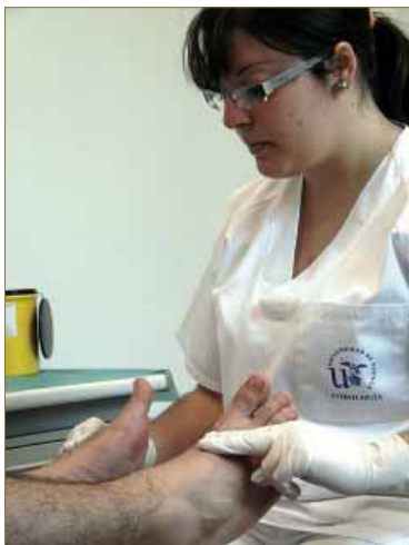
FIGURA 6. La exploración debe ser ordenada, ágil y completa a la vez, sin olvidar ningún dato relevante.

Además de las manifestaciones cutáneas relacionadas con la circulación, se aprecia la temperatura de ambos pies y la presencia de pulsos pedios. En caso de no detectarse, se realizarán pruebas complementarias como el Doppler 4-6 .