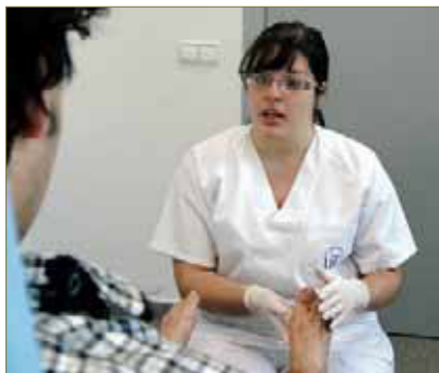
FIGURA 7. El Plan terapéutico integral empieza por la prevención clínica, conjunto personalizado de normas que resolverán o mejorarán cada problema

los datos de la institución, del paciente y del podólogo, el nombre comercial o principio activo, la presentación, la dosis y la duración del tratamiento, que siempre ha de ser limitada en el tiempo y justifica revisiones posteriores para evaluar si sigue estando indicado el fármaco o producto.