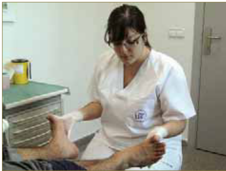
FIGURA 5. La exploración articular se ha de limitar a los movimientos esenciales y hacerse simultánea cuando sea posible

En casos complejos, si se precisan soportes plantares u otras terapias físicas, se debe realizar un exhaustivo estudio biomecánico, con exploración en camilla, en bipedestación y en dinámica.