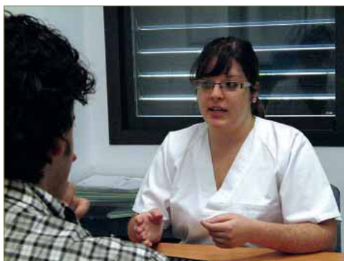
FIGURA 3. Es necesario explicar qué se va a hacer y porqué, antes de iniciar el estudio.

Es una entrevista guiada donde se obtienen datos relevantes de interés podológico. Hay que combinar la conveniencia de permitir expresarse al paciente con la optimización del tiempo empleado. A veces puede ser útil interrumpir amablemente al entrevistado haciendo un resumen concreto de la información que él ha aportado, como forma de seguir con otro apartado de la entrevista.