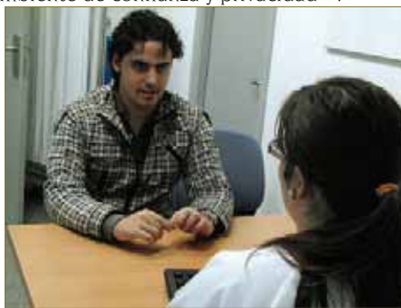
FIGURA 1. Hay que conseguir el respeto y la confianza del paciente para asegurar los resultados.

parte del paciente. Así, el paciente se encontrará en un ambiente de confianza y privacidad 2,3 .