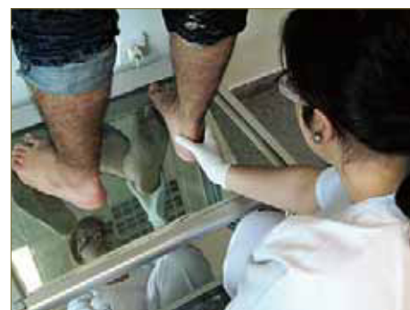
FIGURA 4. Los datos obtenidos en cada fase del estudio deben ser cotejados con los que se obtengan en cada una de las fases.