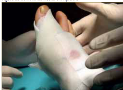
Figura 3: Colocación de fibra de vidrio después de la colocación de gasas estériles. Venda postquirúrgico.