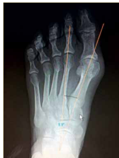
Figura 4. RX prequirúrgica 13 grados IM.

Mediremos el ángulo intermetatarsal entre el primer y segundo metatarsiano, en las radiografías AP en carga y después de la cirugía al mes de la intervención y a los 9 meses de la intervención, para comparar los grados de corrección (si los hay) entre la osteotomía sin fijación después de los 9 meses de estudio. (Figura 4, 5, 6, 7)