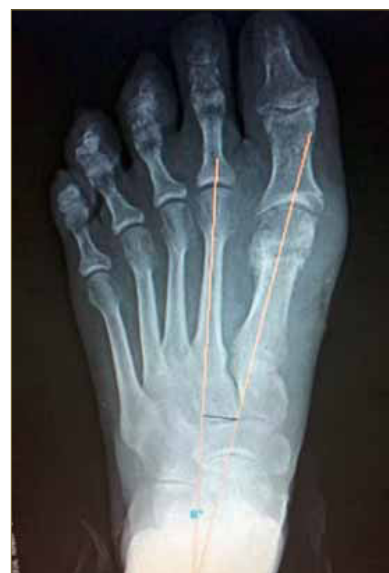
Figura 5. RX post sin fijación 8 grados IM.