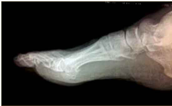
Figura 7. RX lateral a los 9 meses.

Sabiendo que el ángulo entre el 1° y el 2°MTT <11° siendo una deformidad leve, entre 11°-16° una deformidad moderada y por último una deformidad severa >16°.