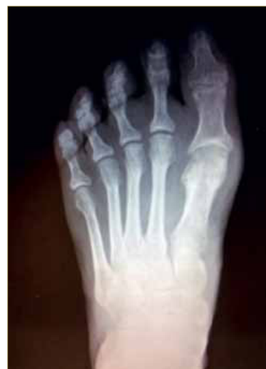
Figura 6. RX después de 9 meses.