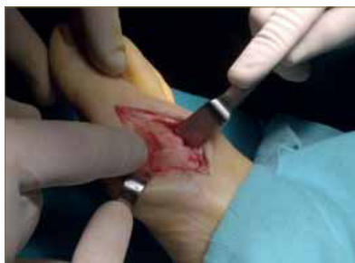
Figura 2: Osteotomía Austin sin fijación.

De esta manera intentaremos determinar si la osteotomía sin fijación es una técnica estable y no produce rotación ni elevación ni pseudoartrosis de la cabeza metatarsiana.