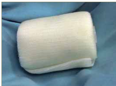
Figura 1: Fibra de vidrio 5 cm x 3, 6 m.

El objetivo principal del estudio es el de determinar a corto y medio plazo, la eficacia y seguridad a nivel clínico de la osteotomía de Austin sin fijación interna con una venda de inmovilización externa de fibra de vidrio.