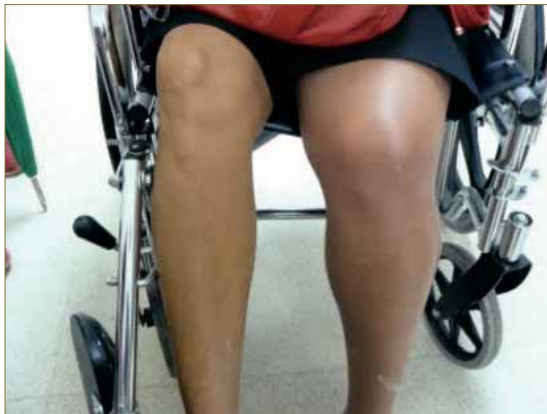
TVP en anciana.